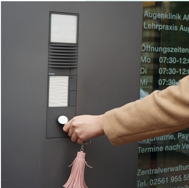
Terminal am Haupteingang (links)

Zum Öffnen des Klinikeingangs halten Sie den Schlüsselchip an das eckige, graue Terminal, welches sich am linken Pfosten der Eingangstür befindet (s. Foto).